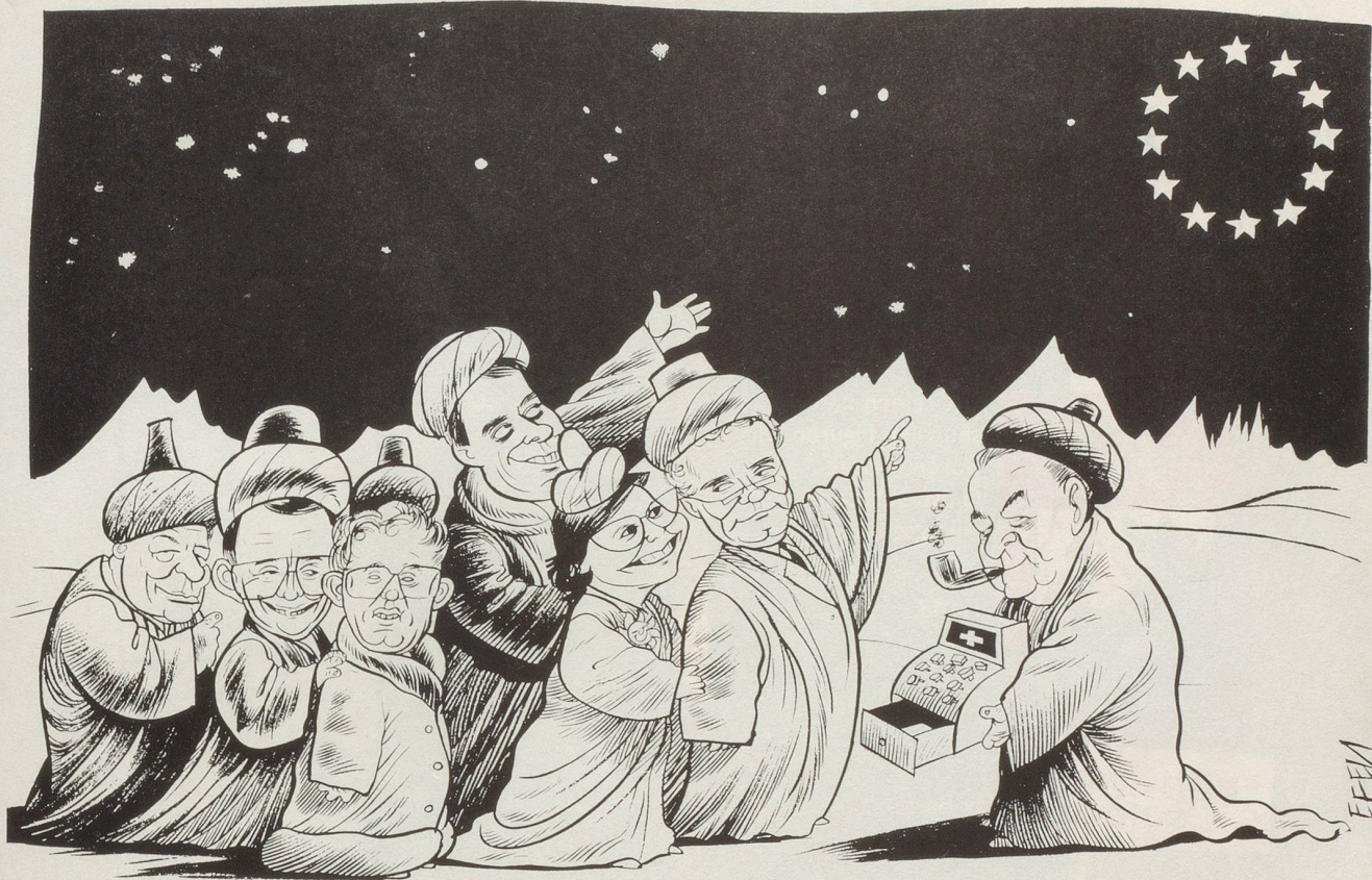
Die sieben Weisen aus dem Schweizerland haben die Leitsterne für die kommenden Jahre gefunden ...