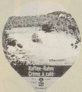
1978/4 Schweizer Bilder III, 15 Sujets (1)