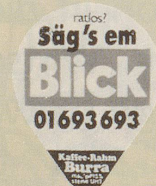
1979/2 Blick, 5 Sujets

A Zeichnung weiss auf d'braun 350.— B Zeichnung weiss auf h'braun 175.— C Zeichnung Gold auf braun 50.— D Zeichnung braun auf Gold 50.— E Zeichnung Silber auf Kupfer 40.— F Zeichnung Silber auf lila 25.— G Zeichnung weiss auf Kupfer 20.— H Zeichnung Gold auf rotbraun 10.— I Zeichnung weiss auf orange 10.— K 75 Jahre VERMO 450.— A-K glatte und gerippte Zungen