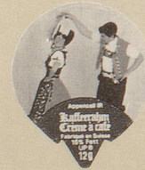
1978/7 Trachten mehrfarbig, 30 Sujets

A Aufdruck Crema 200.— — B Aufdruck Floralp 175.— — C Crema auf weissem Balken 80.— 175.— D Floralp, Lasche Kupfer — —