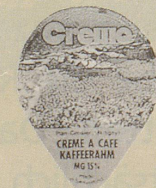
1980/2 Crema, 24/25 Sujets (304)

A spitze Zunge 1750.— B stumpfe Zunge 1500.— 1500.—