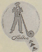
1978/5 Stalden, 4 Sujets

A 3 Dreiecke 425.— B 2 Dreiecke 40.— C 2 Dreiecke 10g 375.— D Zunge oben links — A+B glatte und gerippte Zungen