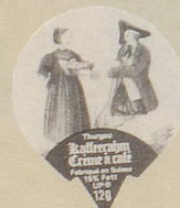
1978/6 Trachten braun, 15 Sujets

A weisse spitze Zunge LP — B braune spitze Zunge 1750.— 1500.— C braune stumpfe Zunge 1750.—