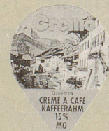
1980/1 Crema, 25 Sujets (303)

A weisse spitze Zunge LP — B braune spitze Zunge 1750.— 1500.— C braune stumpfe Zunge 1750.—