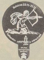
1979/1 Sternzeichen, 12 Sujets

A 3 Dreiecke 425.— B 2 Dreiecke 40.— C 2 Dreiecke 10g 375.— D Zunge oben links — A+B glatte und gerippte Zungen