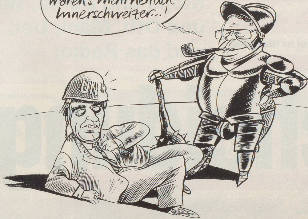
Das Nein der SVP ist in diesem Fall kein speziell zürcherisches Nein . . .

Diesmal waren's mehrheitlich Innerschweizer...!