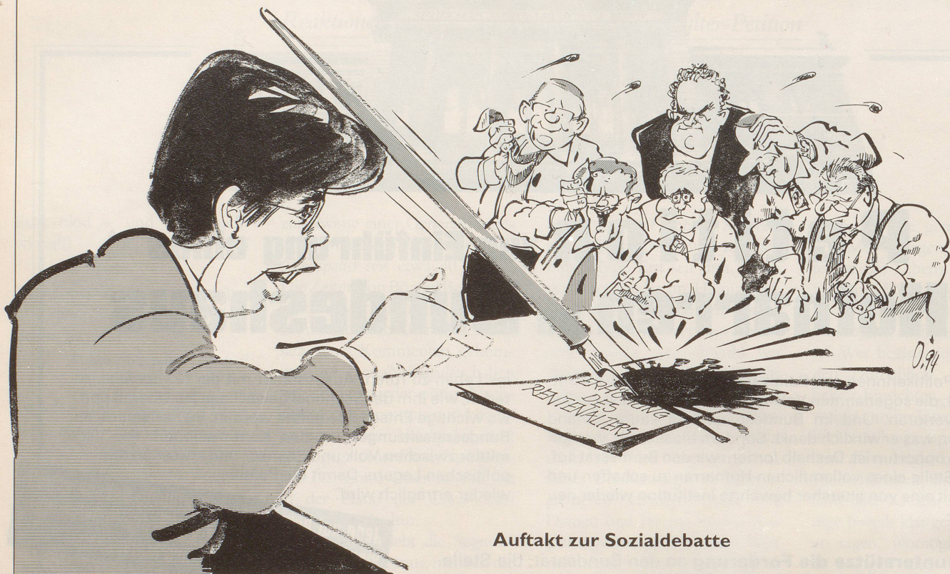
Auftakt zur Sozialdebatte