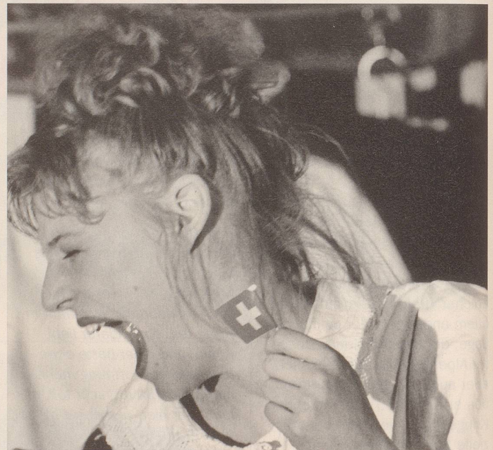
... doch «Suisside» überzeugt nicht: smomos & smomos.

und schöne: Suisside. Zugegeben, in einer einzigen Passage wird Kritik geübt an der Schweiz, an den Rechten und Strammen und an deren Auffassung von Ausländerpolitik. Damit hat sich's dann aber auch schon, es sei denn, man halte sich den Titel des Programms stets vor Augen und male sich angesichts der Gitterstäbe auf dem Estrich, der sauberen Wäsche und der riesigen Wand, hinter welcher wohl Hunderte von Abfallsäcken lagern und hinter die laufend ein