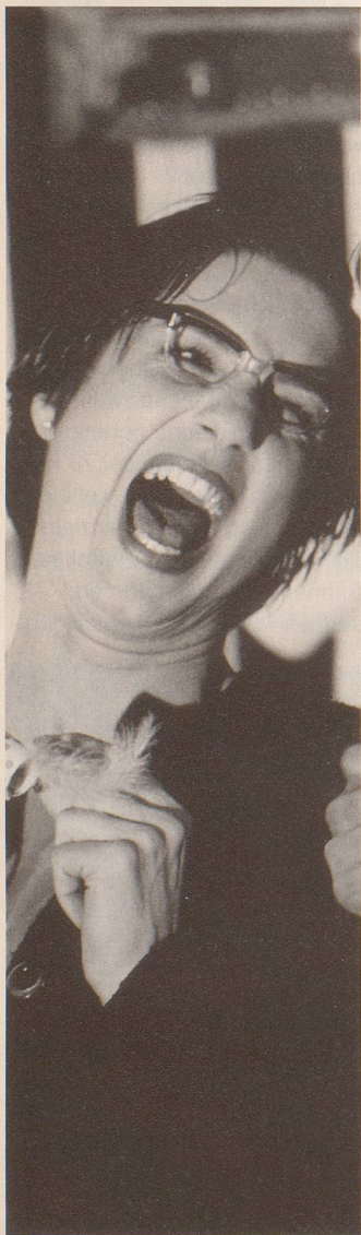
Geben sich redlich Mühe, ...

Das von diesem Glanzstück Eingefasste aber ist leider enttäuschend. «Heitere Geschichten rund ums Abtöten» wollen die beiden Schauspielerinnen zusammen mit ihrem Kollegen bieten, präsentiert werden vor eindrücklicher Kulisse jedoch nicht mehrere heitere Episoden rund um den herbeigerufenen Tod und die marode Eidgenossenschaft, zu sehen ist vielmehr ein langes Stück – dies ist nicht mit Blick auf die Uhr