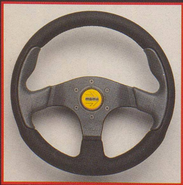
SHUTTLE Ø cm 32 - Ø cm 35