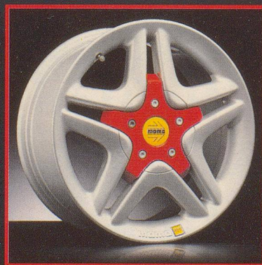
FERRARI ENGINEERING 6 J x 14 - 7 J x 15 - 7,5 J x 16 7,5 J x 17