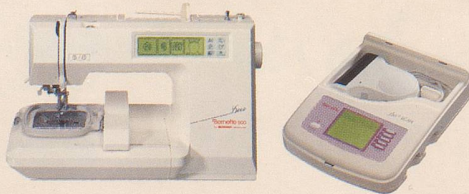
Bernette ® Deco-500 & Deco-SCAN

Variationen. Mit dem Deco SCAN können Sie sogar eigene Motive verwirklichen. Lassen Sie sich diese einzigartige Neuheit zeigen.