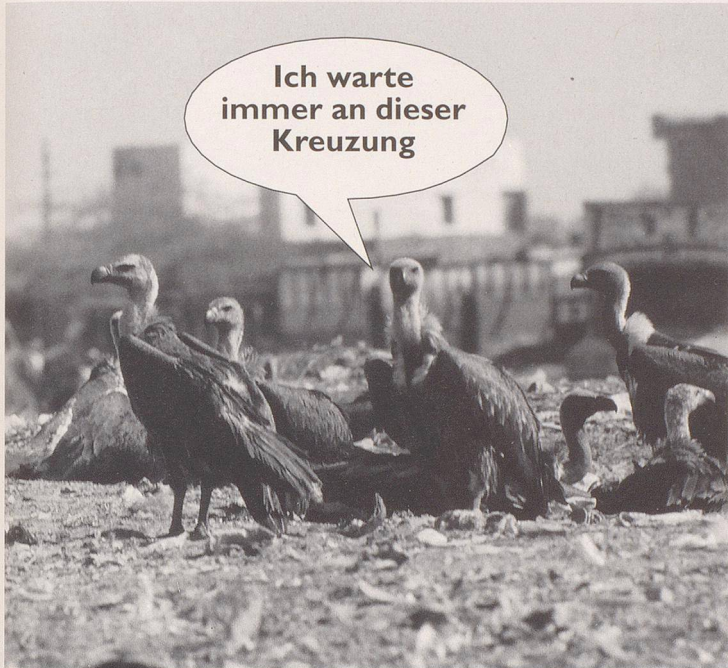
2. ... und die Geschöpfe des Herrn lieben Dich...