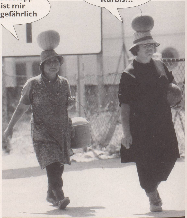
5. Nur Ewiggestrige gehn noch meilenweit...