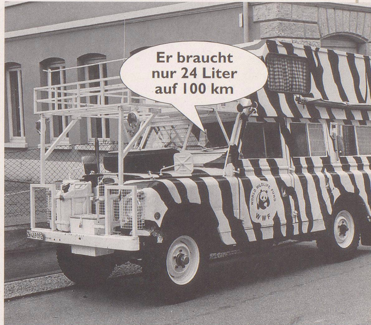
3. ... wie ein Stück Natur.