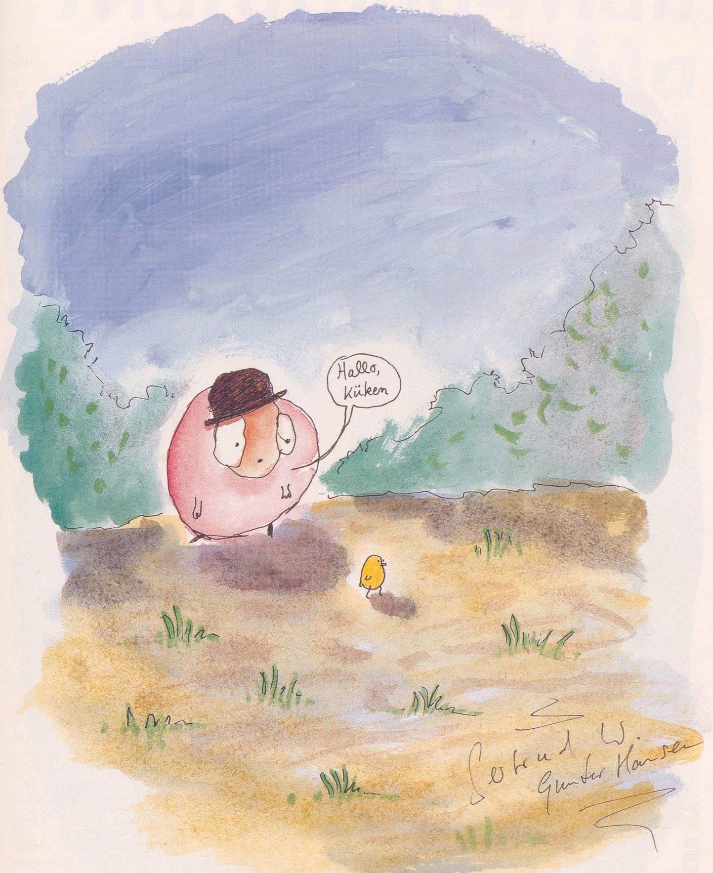
» CALL A KÜKEN « (aus der Reihe: »Rührende Bildchen«)