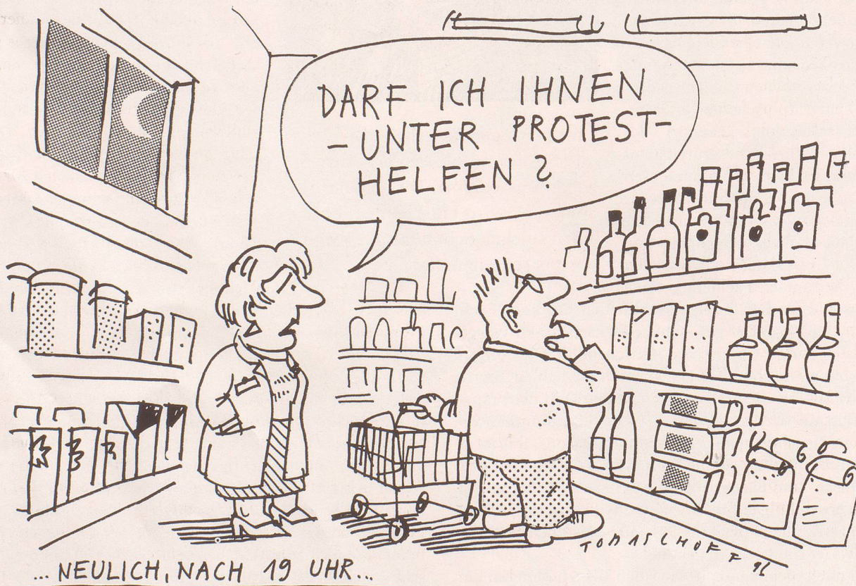
Gütliches Ende der Ladenschluss-Diskussion