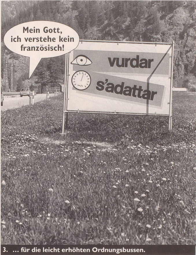
3. ... für die leicht erhöhten Ordnungsbussen.