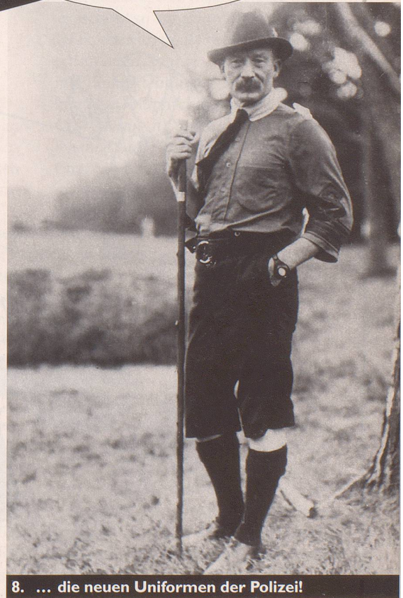
8. ... die neuen Uniformen der Polizei!