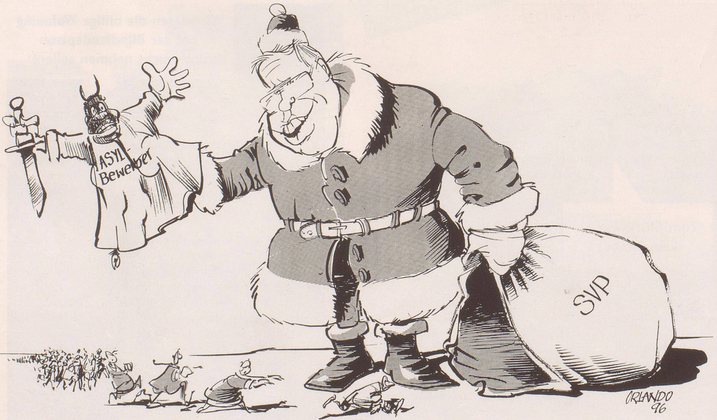
Advent, Advent! Im EMD brennts...