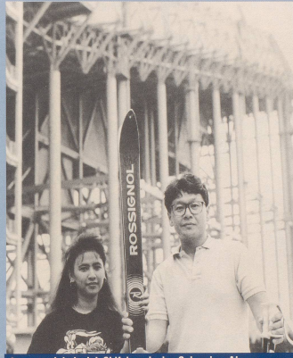
4. ... entwickelt sich Skifahren in den Schweizer Alpen ...