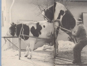
3. ... und trotz befruchtenden Begleitgen am Pistenrand ...