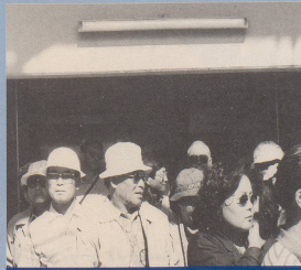
7. ... wird den Gästen aus nah und fern ...