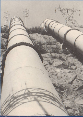
1. Trotz ausreichend dimensionierten Schneekanonen ...