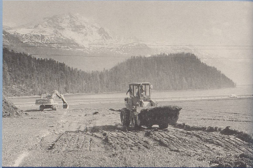
2. ... trotz subtilen Geländekorrekturen an Pisten und Loipen ...