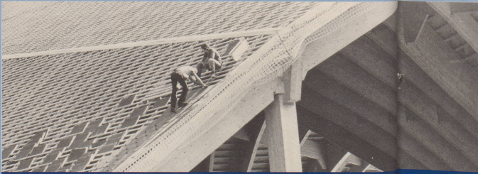
6. Auch dort, wo die neuen Infrastrukturen noch nicht bereitstehen ...