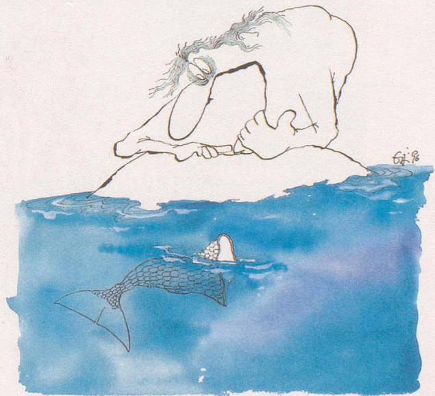
Urs Sandmeier, Schweiz