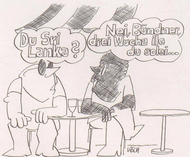
Günther Ursch, Schweiz