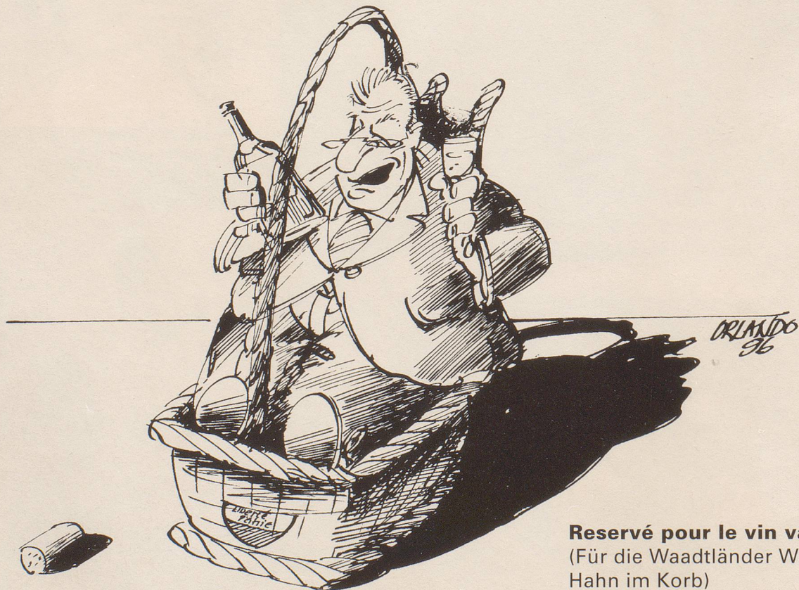
Reservé pour le vin vaudois (Für die Waadtländer Weinlobby Hahn im Korb)