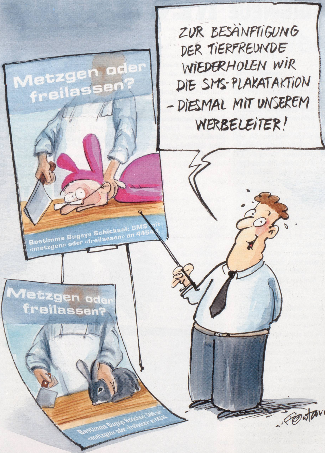
Freiheit geschenkt! Die Hasen-Metzgete von Swisscom mobile ist nicht bei Allen gut angekommen...