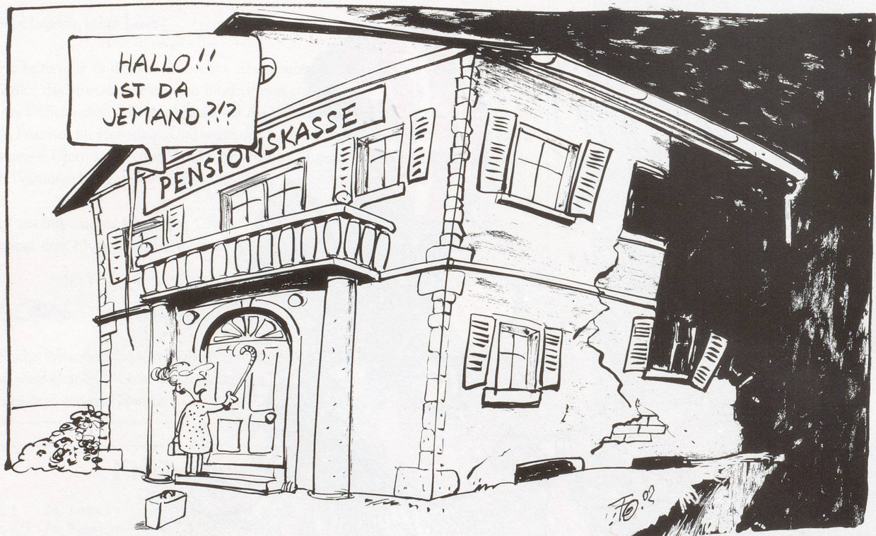
Alles verschenkt! Mit etwa 50 Milliarden Franken Börsenverlust stehen viele Pensionskassen dicht am Abgrund.