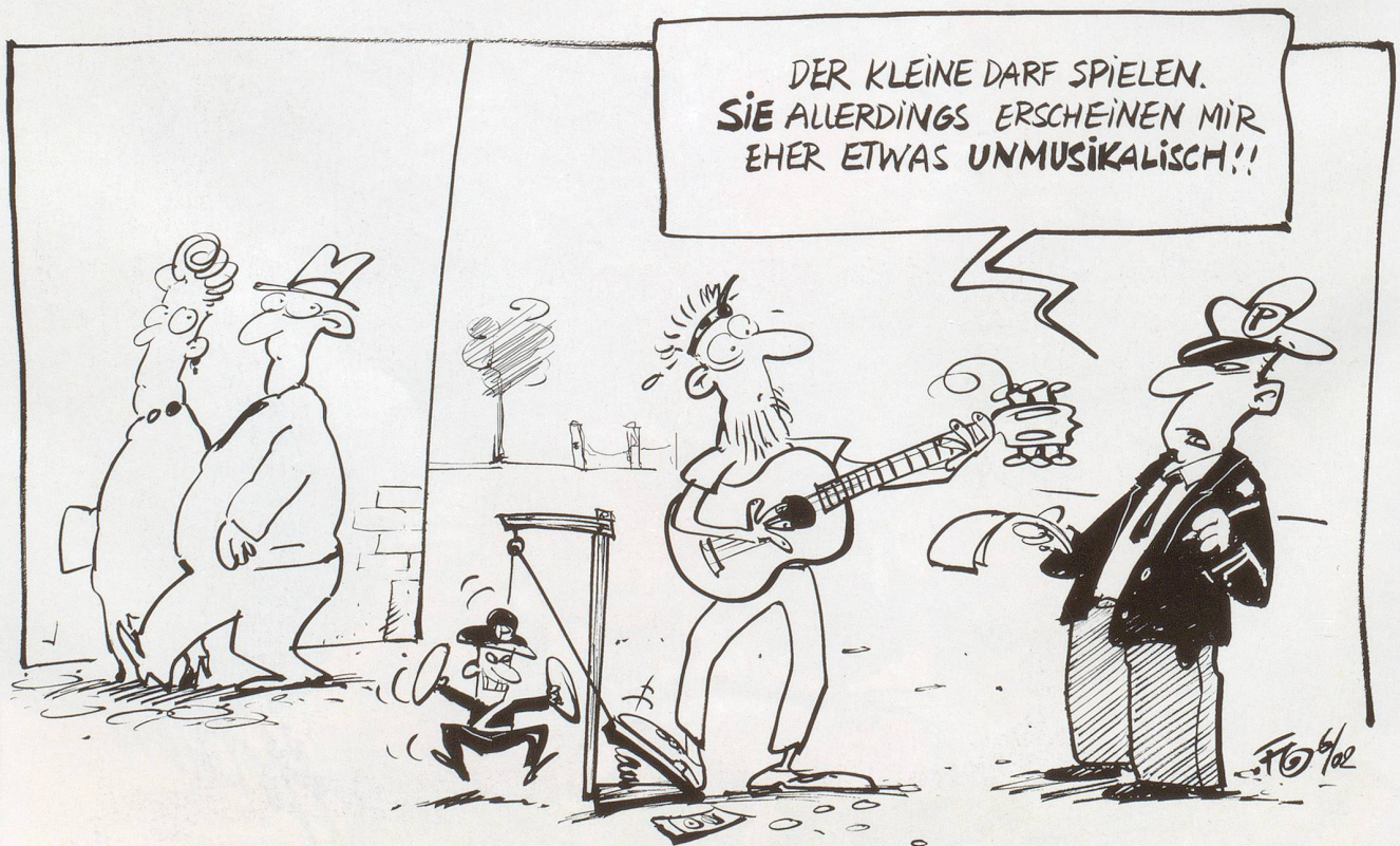
Neue Töne! In Biel ist Strassenmusik wieder erlaubt. Die Musiker werden jedoch vorher genau geprüft.