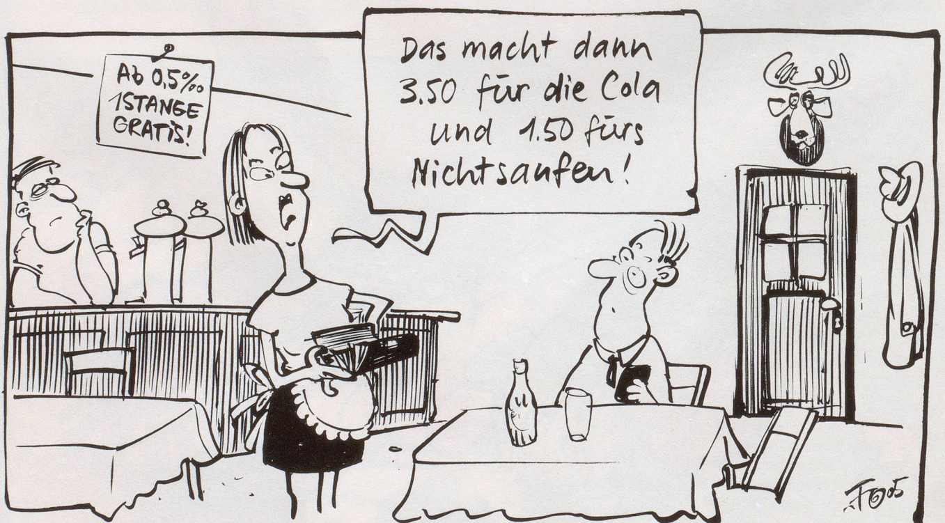
Seit der Einführung der 0,5-Promillegrenze klagen Westschweizer über Umsatzeinbussen. Sie erwägen einen «Pane e coperto»-Zuschlag, um den sinkenden Alkoholkonsum auszugleichen.