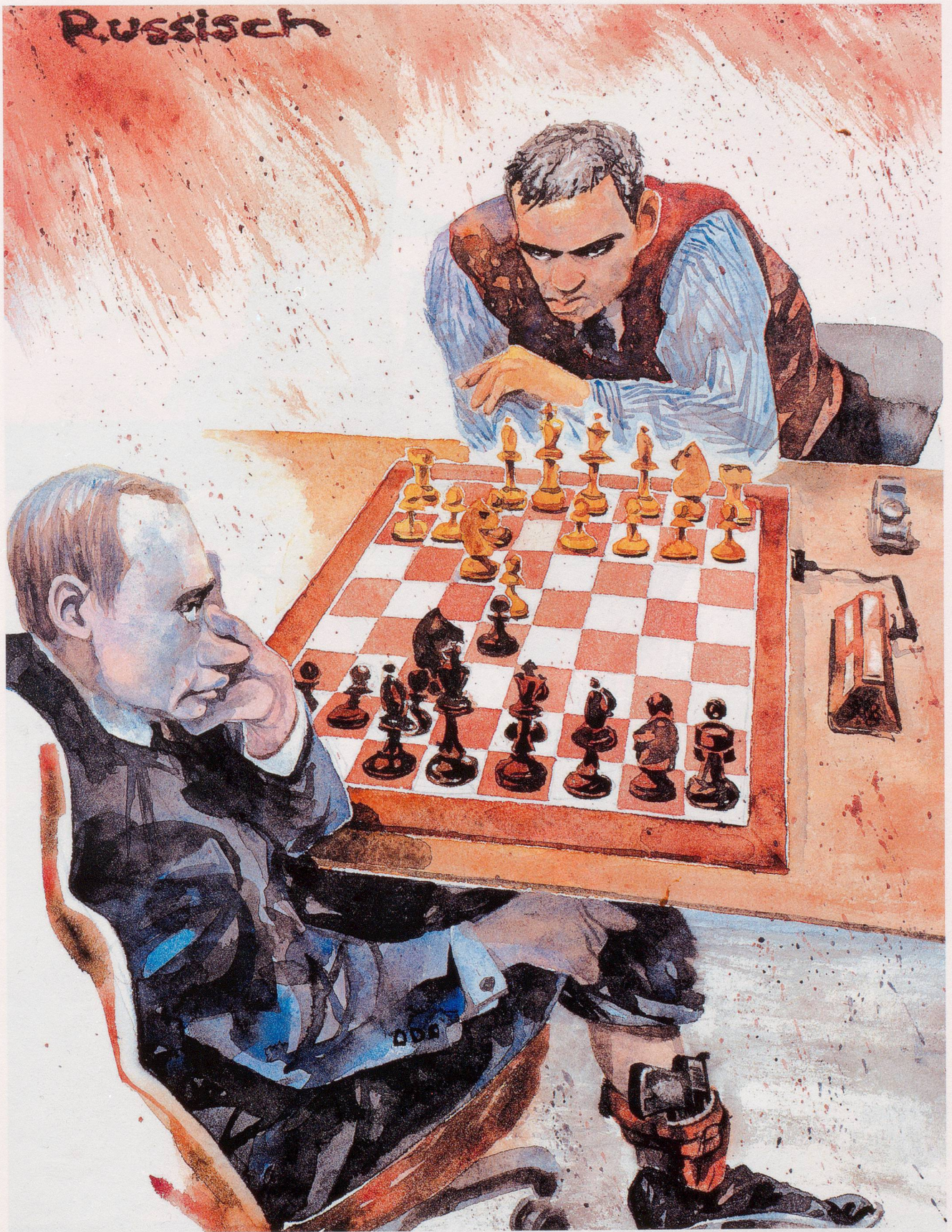
Altmeister Garry Kasparov wechselt vom kleinen aufs grosse Spielfeld – mit dem Ziel, im Moskauer Kreml bis 2008 eine Machtrochade zu erreichen.