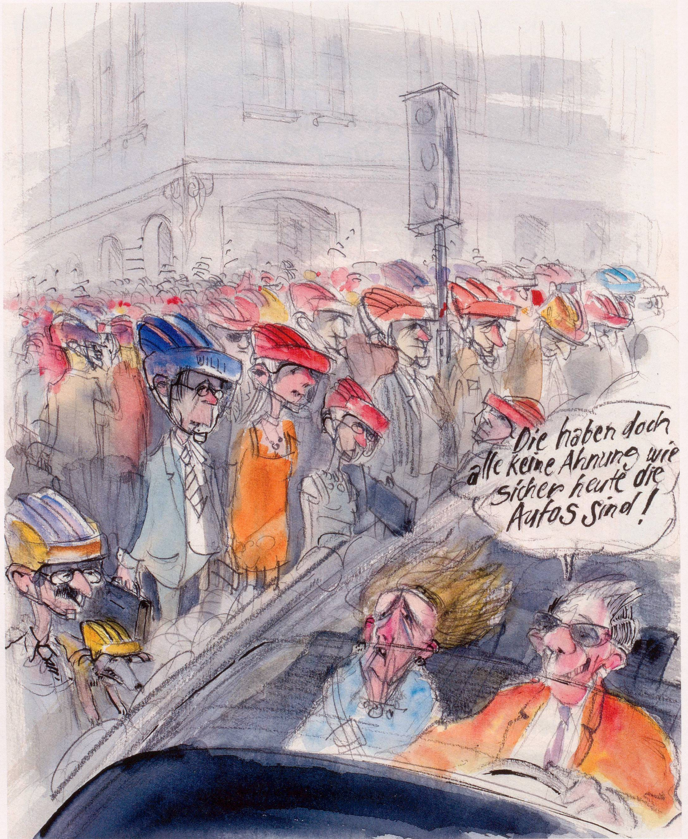
Bald Helmtraggpflicht für Fussgänger? Während Schädelverletzungen bei helmgeschützten Radfahrern abnehmen, sind diese bei den Fussgängern zunehmend.