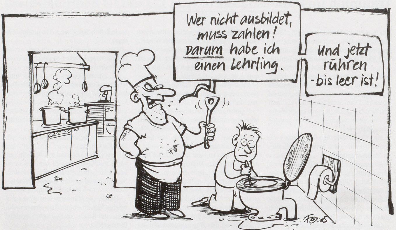
Regierung und Gewerbeverband prüfen die Gründung eines Berufsbildungsfonds, in welchen Betriebe, die keine Lehrlinge ausbilden zu Gunsten von Lehrbetrieben Beiträge entrichten.