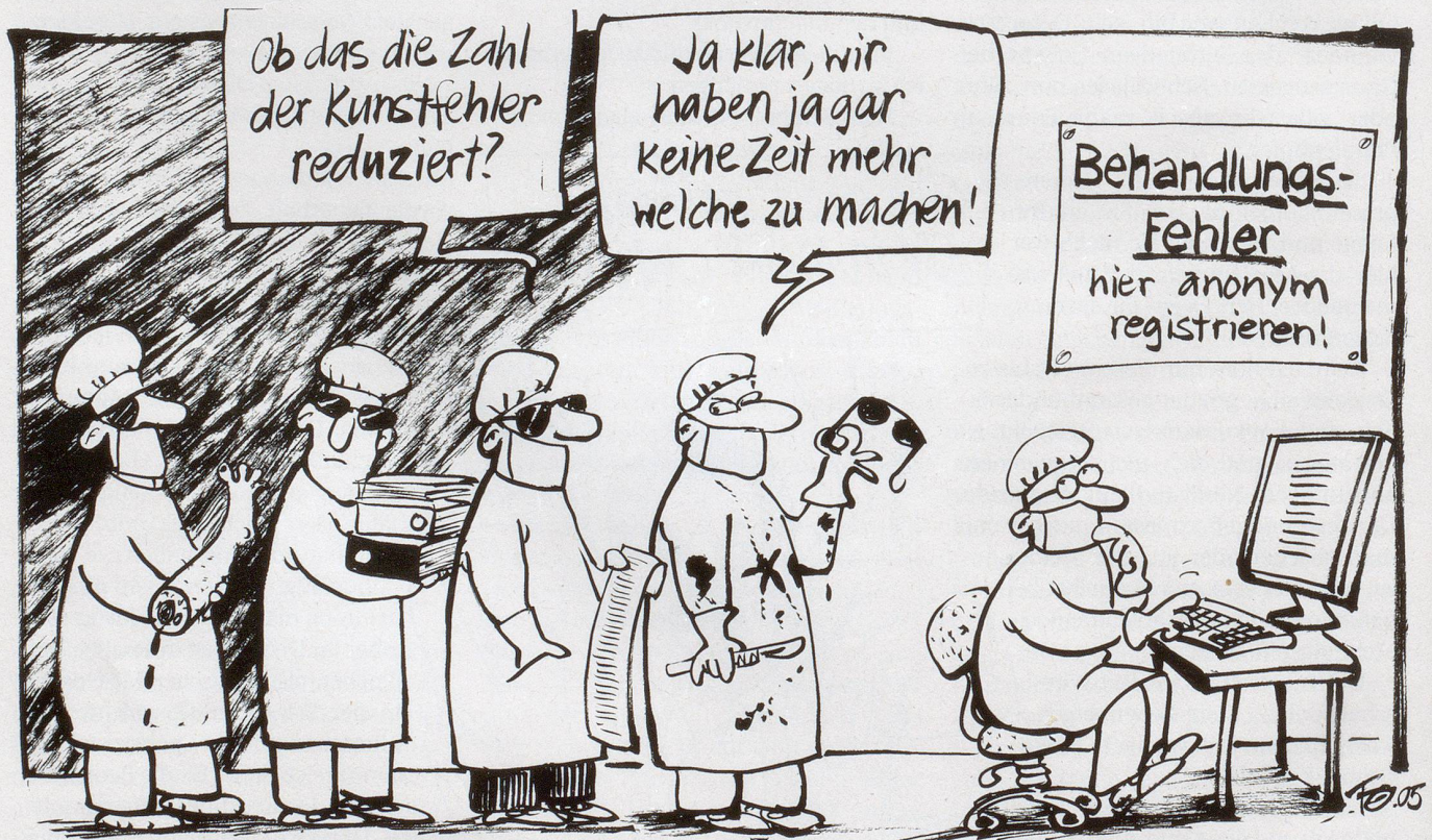
Neue anonyme Meldesysteme sollen die alarmierenden Fehlerquoten in den Spitälern vermindern. Ohne die weissen Kittel zu beschmutzen ...