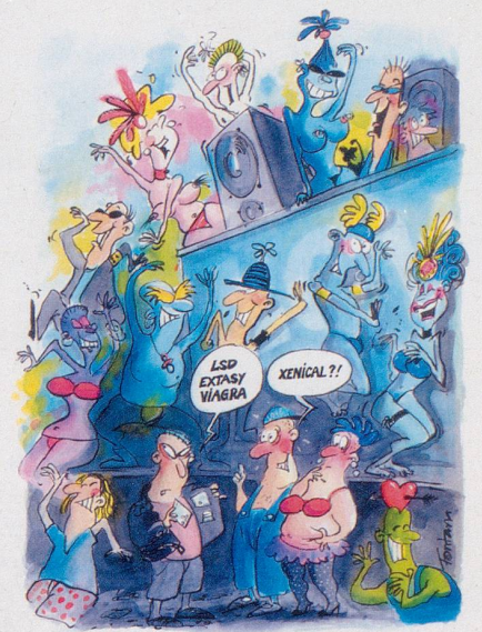
Nach illegalen Höhenflügen und chemisch gesteigerter Potenz, bald: Werden Sie legal schmal mit Xenical!