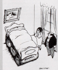
«Ich als Kaffeehausbesitzer will den A-Werk-Gegensinn beenden, wie hiermit die Lagerung abzubauen Müll im Grunde genommen ist.»