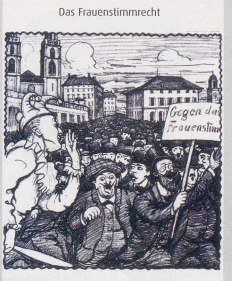
Nebelgallen: «Mir keine Aufregung, wertere Herr! Ich handelt sich nur um eine Formsache. Unsere Gesetze machen ja ohnehin die Frauenweiser.»

Wenn ich zurückblicke, muss ich sagen, dass sich mein Kampf gelohnt hat. Ich würde auch alles wieder genau so machen – bis auf die Sache mit dem Callboy. Damals.