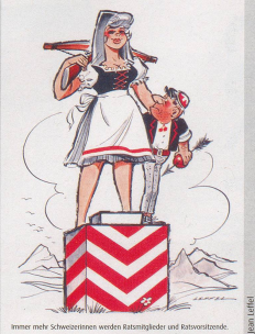
Inmer mehr Schweizerinnen werden Kantonsrätin und Kantonsrätin.