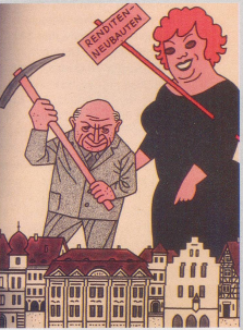
Hochregentur und Spekulation, die Schäden der alten, schönen Stadtkerne. 1961