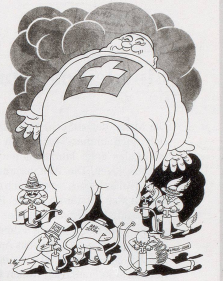
Stehende Hochkonjunktur «Es ist sich ein zu wollen. Aber mit der Zeit kommt es unangenehm werden» 1961

Besseres anzufangen, als sich zu emanzipieren. Auf den Nierentisch und die Feuerzangenbowle blickt man nun herab, als wären sie Ausdruck der überlsten Biedermeierei. Die meisten Ikonen der Zeit sind relativ früh und oftmals tragisch von der Weltbühne abgegangen. Das Wort Hochkonjunktur ist zwar auch heutzutage in aller Munde, aber keiner glaubt mehr so richtig an Ihre Machbarkeit. Nur einer hat, beinahe wie ein Fossil, die Epoche überlebt, der einsame alte Mann in Havanna, Fidel Castro. Dort soll es auch noch ein wenig wie in den fünfziger Jahren aussehen, nur fehlen der Glanz und Optimismus. Castro hatte auch nie was mit freiem Markt und Wirtschaftswunder im Sinn, sich vermutlich auch nie gefragt, was Frauen wünschen. Er, der sich als ungeschickter, aber zäher Revolutionär und zaudernder Ideologe einen Namen gemacht hat, führt nun ein spartanisches Leben und hält manchmal noch fünfständige Reden, die er nach wie vor mit dem Pathos des Kalten Krieges vorzutragen pflegt, was einige seiner Zuhörer aber nicht vor dem Einschlafen bewahrt.