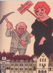
Hochregenerat und Spekulation, die Schrecken der alten, schönen Stadtfriede 1961