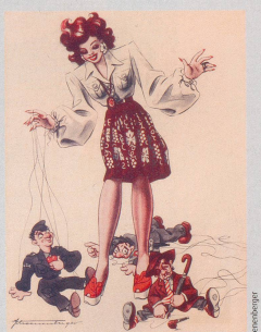
Der vom Himmel gefallene Amerikaner, nun reichte Kalkül!