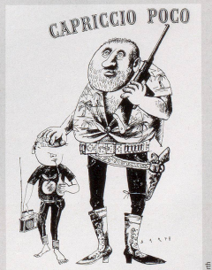
Mit 1965 oder «die Überbrückung» durch italienische Geldgeber!