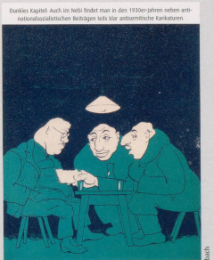
1934 «Hier Bürgerkrieg – und wir haben keine – geht ich Ihnen für schweizer Anzucht und den Rest in zehn Jahren. Sie sagen ja, und wir sind Schweizer – abgemacht!»

• 1927 Der legendäre Carl «Bibi» Blüchl übernahm die Chefredaktion des Nationalsozialisten. Die Auflage stieg stetig. Joseph Ratzinger verlor in Mailand am 10. Juni die Wahl des Papstes.