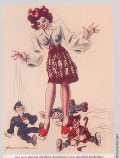
1944 Der vom Himmel gefallene Amerikaner, nun verweicht Kalkstein!