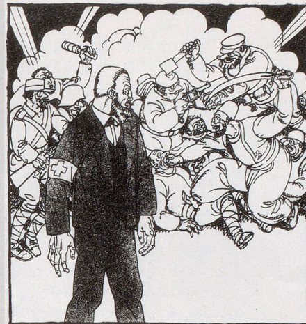
«Potz Chaib! – Wann ich da nu am End nüd au na muess mitmache!»