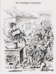
1895 Helvetia (Zweizweifel), «Mit Supp wend sie ein»