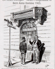
1895 Batschard zum Posten Borer: «Hingeg ist me für die Beamten de oberspann dinsten reuert und darf vom Postamt der Behördensache nicht besetzt werden! (Völl. beamtenverwehrt)»