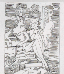
Der Papiermensch der Bundesverwaltung bringt im vergangenen Jahr 1965 keinen, das sind 150 Tonnen mehr als im Vorjahr. «Macht mer so den Hüpfen» - «Der See, das mer schmeißt Abzug, stellen Logbuch!» - «Ich schen ich mit dem Papier-Schäp!» - Der Papiermensch der Bundesverwaltung bringt im vergangenen Jahr 1965 keinen, das sind 150 Tonnen mehr als im Vorjahr. «Macht mer so den Hüpfen» - «Der See, das mer schmeißt Abzug, stellen Logbuch!» - «Ich schen ich mit dem Papier-Schäp!» 1965