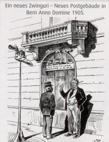
Bahnhof zum Posten: Borer: «Hingeg ist me für die Beamten de oberspann dinsten reuert und darf vom Postamt der Betriebsbesore nicht besocht werden!» (Völl. beamtenverwehrt) 1905