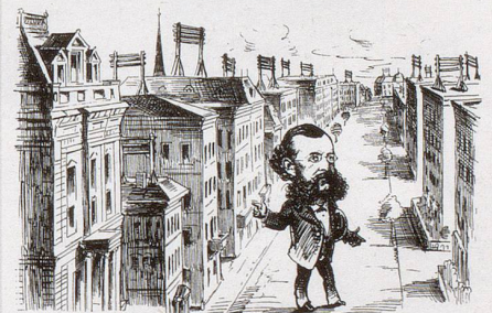
Freuler: «Merkwürdig, Zürich stimmte gegen die Todesstrafe und nun hat es doch auf jedem Hause einen Galgen! Wie sich die Menschen ändern!»