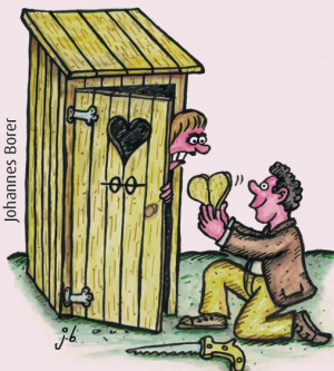
NICHT ALLE FRAUEN SCHÄTZEN ORIGINELLE LIEBESBEZEUGUNGEN.