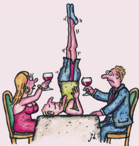
NICHT JEDE KERZE PASST ZU EINEM ROMANTISCHEN ESSEN.