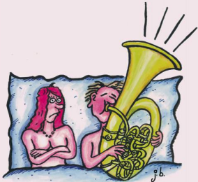
EIN ZU LAUTES VORSPIEL BRINGT NUR DIE NACHBARN AUF DIE PALME.