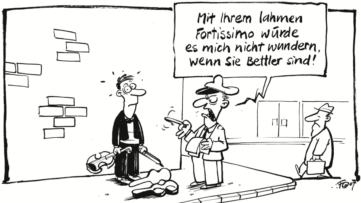
Die Polizisten der Stadt Genf testen ihre Strassenmusiker. Sie sollen herausfinden, ob ein Strassenmusiker wirklich Musiker oder doch nur ein getarnter Bettler ist ...