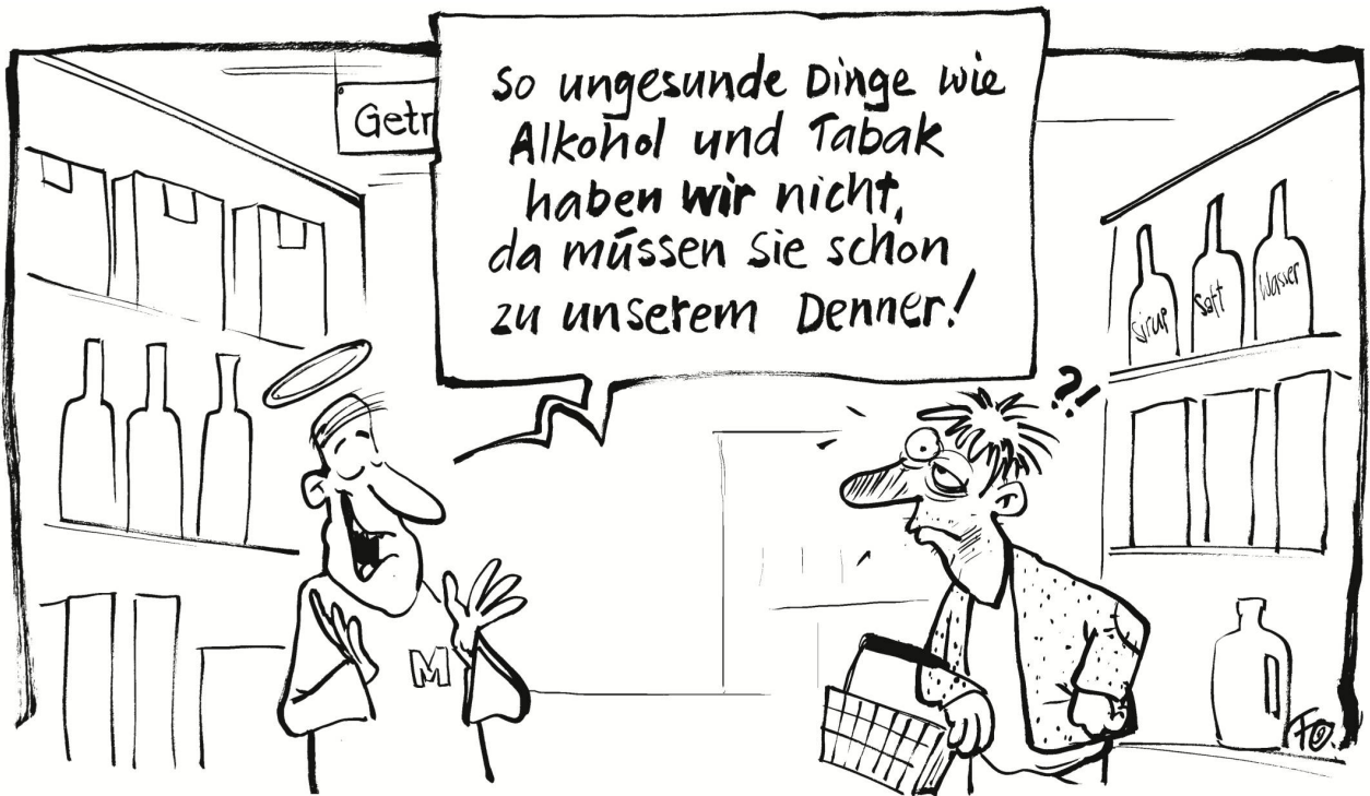
Der «orange Riese» Migros schluckt den Discounter Denner. Jetzt ist auch das Geschäft mit «Volksgesundheits-schädigenden» Produkten möglich. Prost!