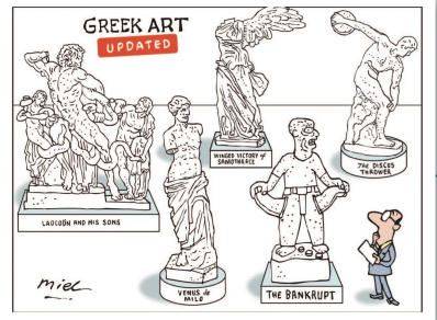
Jürgen Tomick | Deutschland Verkaufsschlager