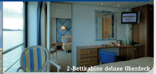
2-Bettkabine deluxe Oberdeck