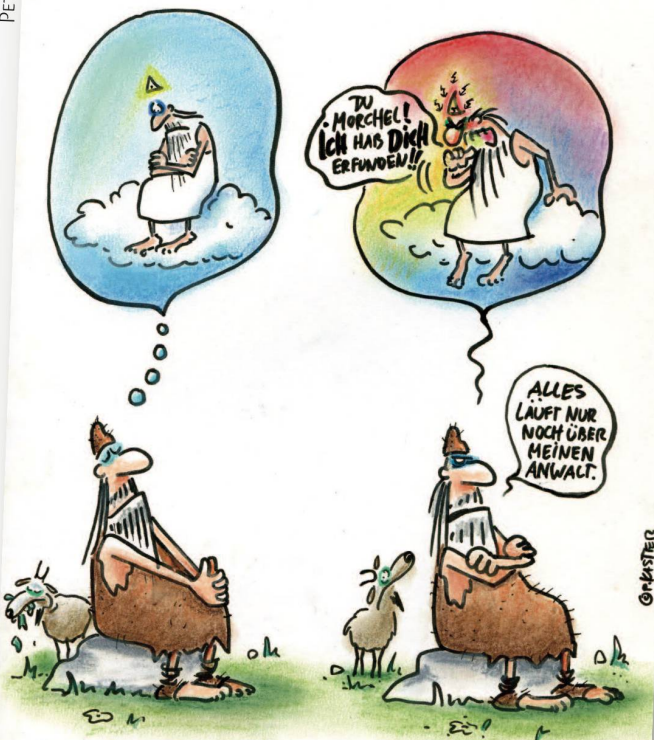
IN DER SPÄTEN FREIZEIT ERFAND EIN HIRTE AUS DEM LANDKREIS DRÜBEND ORF GOTT.