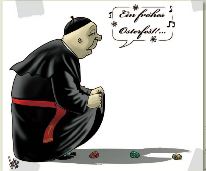
SWEN | SILVAN WEGMANN