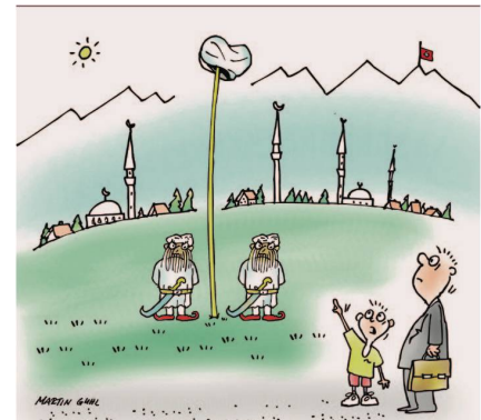
«Ei ... Vater, sieh den Hut dort auf der Stange!!»