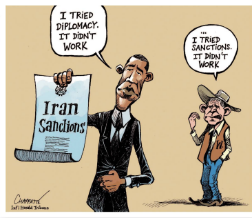
Patrick Chappatte International Herald Tribune Diplomatie versus Sanktionen Rainer Hachfeld Neues Deutschland Die Entdeckung ungeheurer Bodenschätze