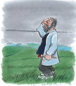
Blöder Künstler – nach England gefahren und Grau und Grün vergessen...