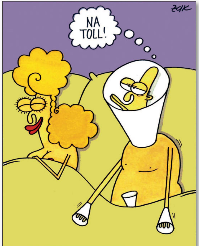
WO MAN DIE MEISTEN FRAUEN TRIFFT, DIE EINE DIÄT ABGEBROCHEN HABEN