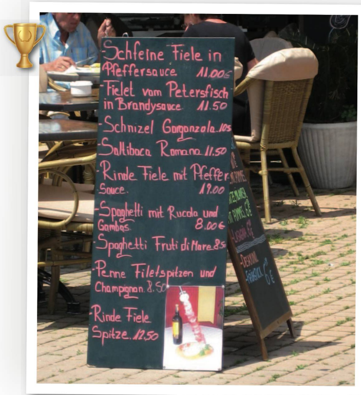
Fiel Auswahl vom Schfeinsten: Sabine Nellen (Meyrez) auf Mallorca.