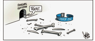
Swen (Silvan Wegmann) Und tschüss!