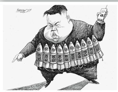
Petar Pismestrovic Österreich Hände hoch, oder es knallt!