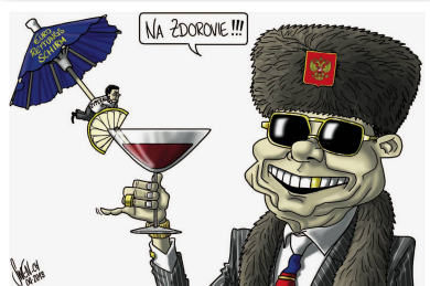
Sven (Silvan Wegmann) Zypern – eine Kolonie russischer Oligarchen. Jürgen Tomicek | Deutschland Auslaufmodell.