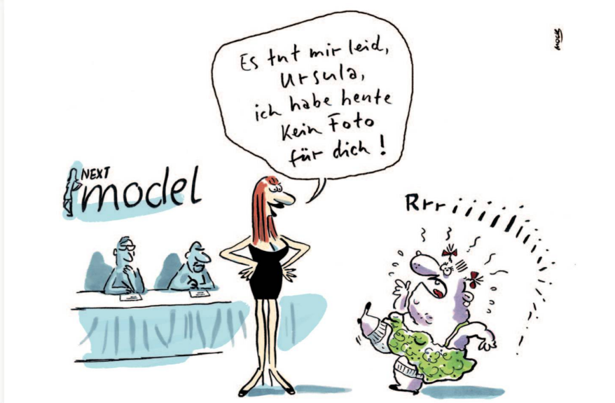
MOCK (VOLKER KISCHKE)