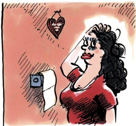
MARJA - TSCHECHIN - DRITTFRAU - FÜR GE- WISSE MINUTEN...