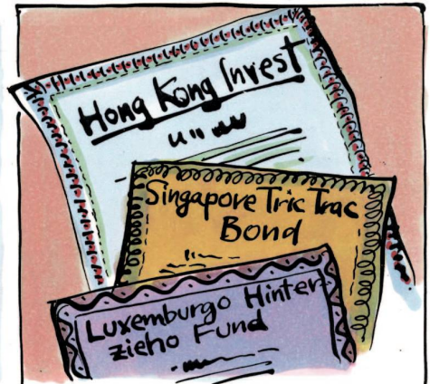
UNSERE KAPITALANLAGEN - IM AUSLAND ARBEITET GELD EINFACH BESSER...