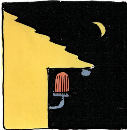
ØRENGETØSE - UNSERE DÄNISCHE ALARM- ANLAGE.