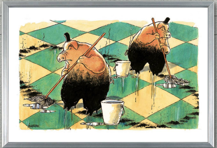
MICHAEL KOUNTOURIS, GRIECHENL., CLEAN UP

Triennale der komischen Kunst 7. bis 22. September 2013 Programm, Öffnungszeiten und Informationen: www.cartoonfestival.ch