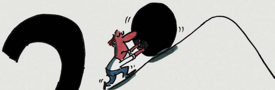
IMMER WIEDERKEHRENDE FRAGE