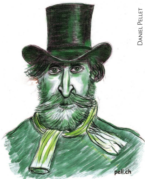
Undatiertes Porträt des grossen Giuseppe Verdi, als dieser sich einmal grün geärgert hatte.

G iuseppina hiess seine zweite Frau: G+G wie heute für Glanz und Gloria.